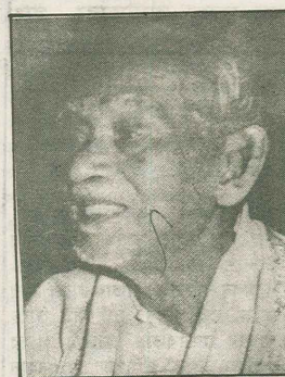
এক্স এম, এল এ নন্দকিশোর সিংহ সমাজর এলার সুরকার আগে হিসাবে গিরকর পরিচয় হৌবারাদেউ (শেষ পৃঃ ৩-এর কঃ দেখুন)

আমার সমাজর আরাক ডাঙরিয়া আগে ইলতাই অজা সুরনাথ। আমার